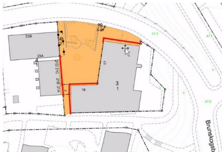
Brunskögsbacken i Farsta Strand.

Den tredje justeringen som gjorts är en utökning av alkoholförbudet kring Farsta centrum för att även omfatta grönområdet ovanför Larsbodavägen i höjd med tunnelbanan. Detta mot bakgrund av att det under en längre tid har funnits en otrygghetsproblematik med nedskräpning i samband med alkoholmissbruk.